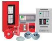
Detección de incendios