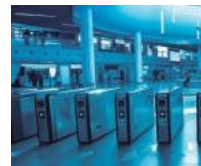
Control de acceso

Aplicables para la industria, comercio, Call center, oficinas en pequeños y grandes proyectos en todo el territorio nacional. Comprometidos con una excelente reputación de servicio, confiabilidad y satisfacción total de nuestros clientes.