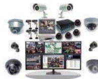
Circuito cerrado de TV