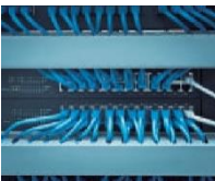
Sistemas de voz y datos