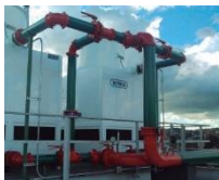
Sistemas de aire acondicionado y ventilación mecánica

Aire y Energía Ltda fue creada en el año 2002, una empresa con experiencia en el diseño, suministro, instalación y mantenimiento de sistemas entre los cuales se encuentran: