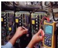
Automatización de procesos industriales