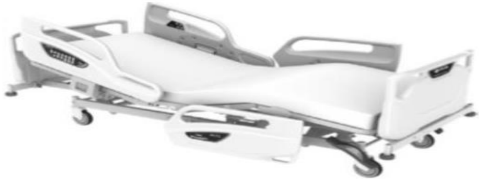
Camilla paciente adulto