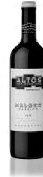
Altos Las Hormigas Malbec 375 cc