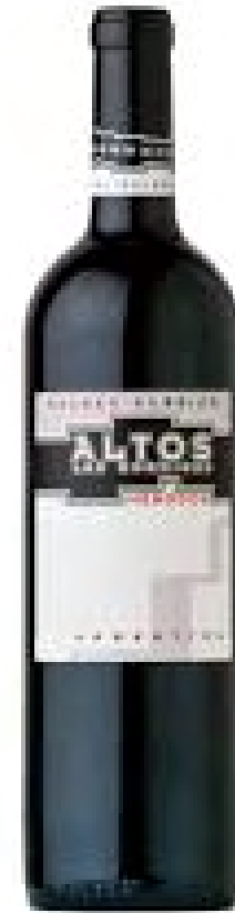
Altos Las Hormigas Malbec