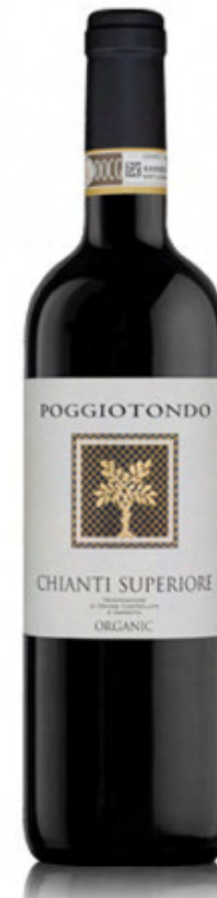
Poggiotondo Chianti DOCG Superiore Organico