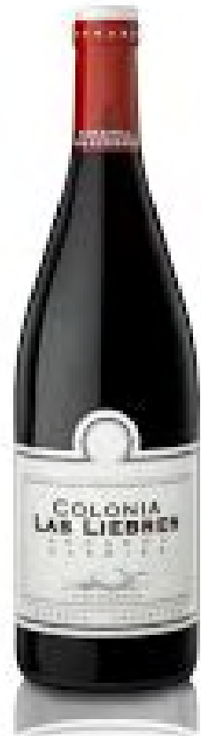
Colonia Las Liebres