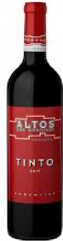
Altos Las Hormigas Malbec , Semillos, Bonarda