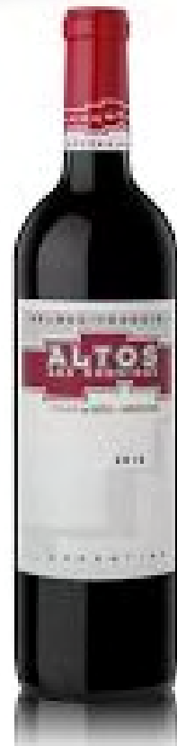
Altos Las Hormigas Malbec Terroir