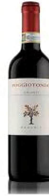
Poggiotondo Chianti - Organico